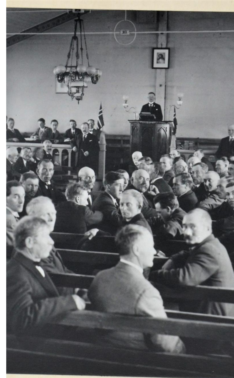
Fiskernes Faglige Landslag - 16. juli 1926